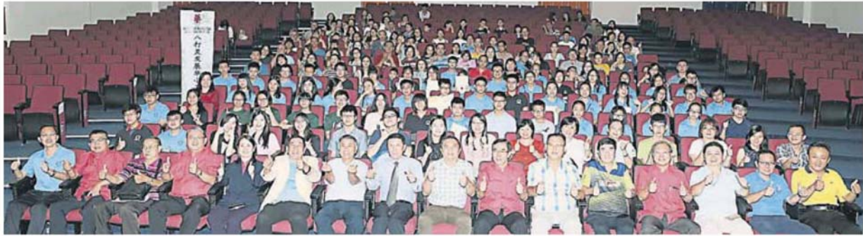
八打灵发展华小工委会举办八打灵国中华文进修班结业礼活动，获得多位嘉宾、学生及家长的出席。