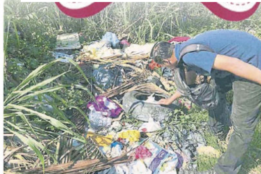
■ 排除已成为黑好蚊滋生之处。近期頻下雨，也形成一些積水的地点出現，也不