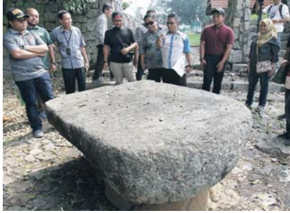
BATU Hampar dikatakan satu tempat seorang dayang istana yang dipancung kepalanya.

Beliau didakwa telah berzina hingga sultan menjadi murka. Darahnya dikatakan disimbah di sekitar Kota Melawati sebagai pengajaran kepada rakyat agar