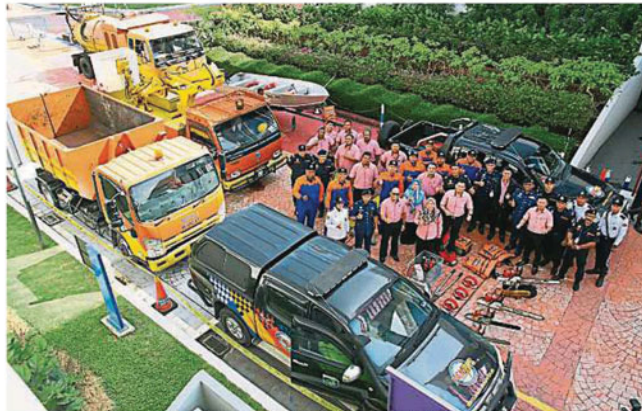
梳邦再也市议会的快速队伍及救援人员准备就绪，迎接即将来临的东北季候风。

她说，在市议会的指挥中心，可从荧幕上看经常发生水灾的地图，这些地区从10年前开始监督，一旦某个地区水灾，该地图将会“亮灯”，他们会寻找最快速的路线抵达目的地。