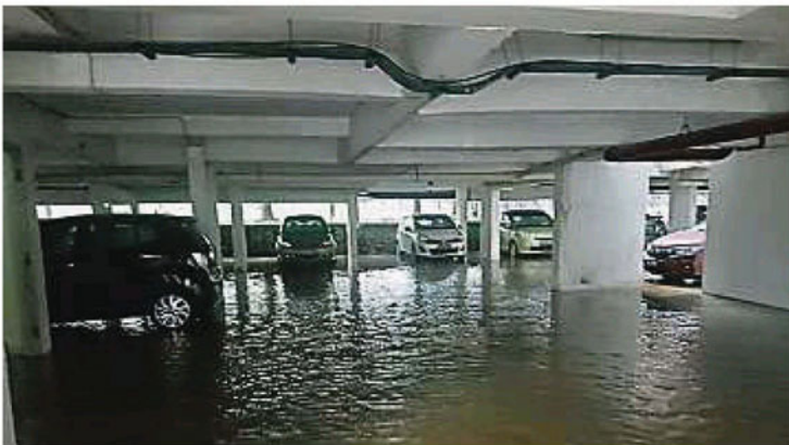
某公寓斜坡修复进行中，大雨将泥水冲入底层停车场。

他指出，今午的强风雨太大，很多树木不堪一击而吹倒，目前他没有接获任何人受伤的投报。