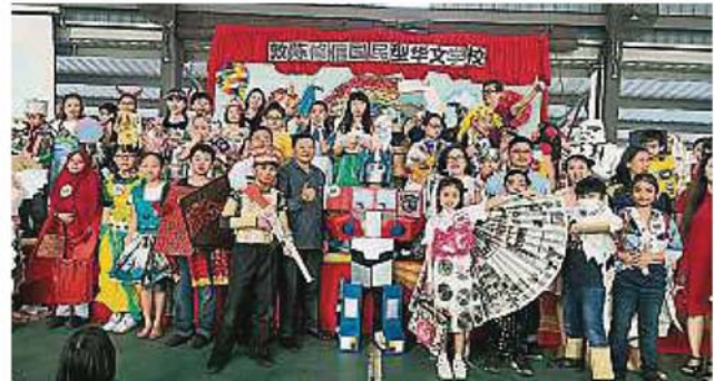
儿童节环保服装比赛参赛者与董家协成员合影。

她也希望学生能从小就树立远大的理想，培养优良的品德，在校做一个好学生，在家做个好孩子。