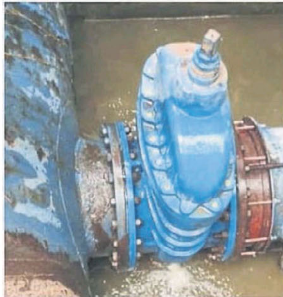
甲洞園坵蓄水池的水泵嚴重漏水。

用戶也可以通過WhatsApp發送緊急訊息至019-281 6793 或者 019-280 0919。