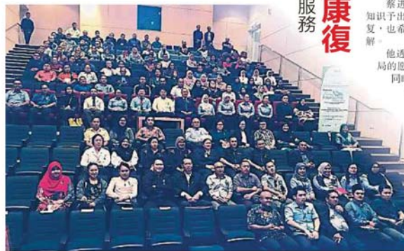
出席者与嘉宾在2019年辅导月“男子及精神健康：沉默的杀手”论坛上合影。

陈长锋解释，民众必须改变想法，因为辅导是一个专业的援助过程，它使患者了解自己及其困境。他希望当天的论坛能提升民众对精神健康问题的认知，尤其是面对患者时，如何为后者舒缓压力。