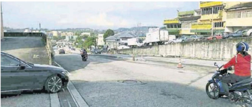
随著分界堤的设立，对于沿途的路口造成影响，车辆无法转往对向车道。