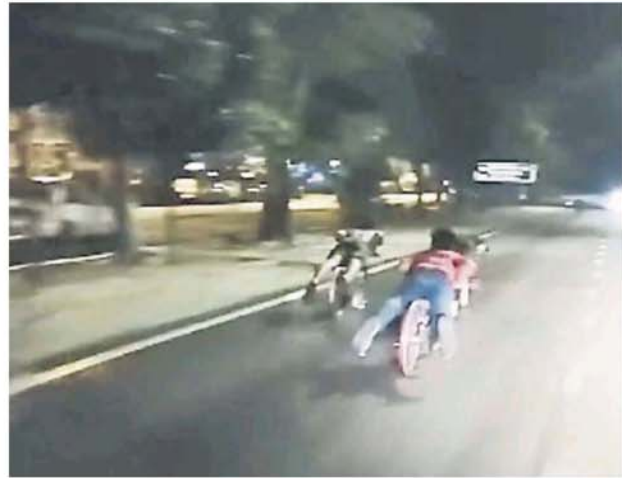
蚊子脚车党夜间在大马路上玩命“飙车”，置生死于度外。