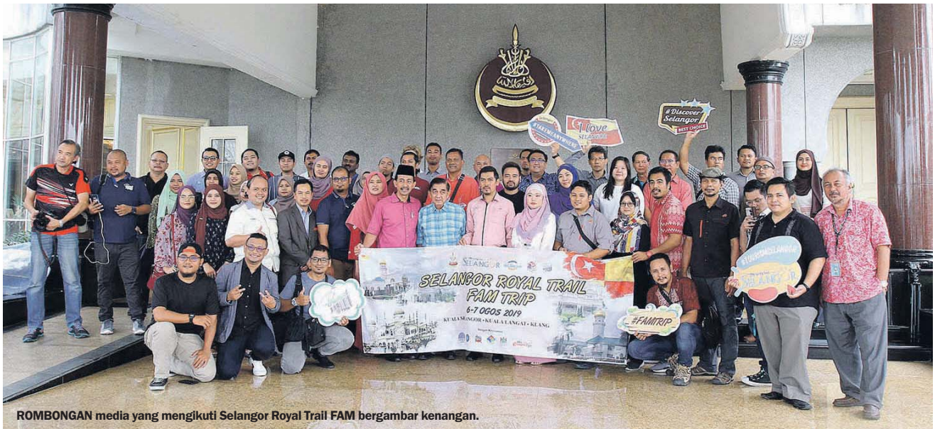
ROMBONGAN media yang mengikuti Selangor Royal Trail FAM bergambar kenangan.