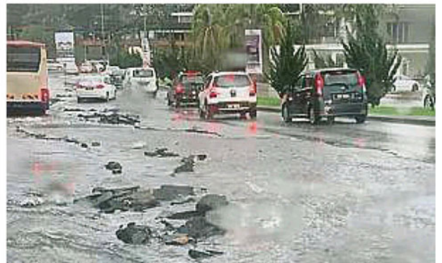
双溪龙镇一条马路，只要遇到大雨就会被冲毁，过去多次重铺，情况依然。