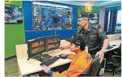
官员们时刻在指挥中心监督区内的天灾问题。