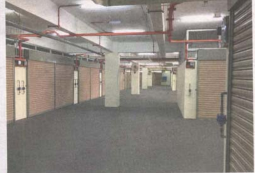
The first floor of the building with lots allocated for food operators is deserted.

The old market was located on 9.8ha plot and had a futsal court, food court and had an area for stalls.