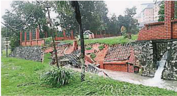
↑降雨量太大，溝渠水來不及疏導溢出，影响公寓圍牆坍塌。 →大树不堪强风雨吹袭倒下，压中轿车。