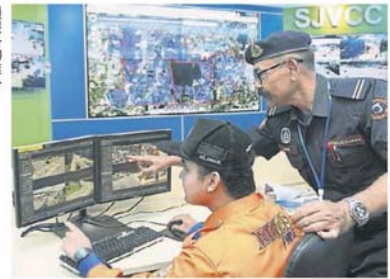
■梳邦再也指挥中心时刻关注黑区的情况。