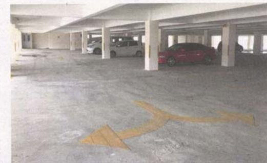
The covered carpark at the new building will be run by MPS.