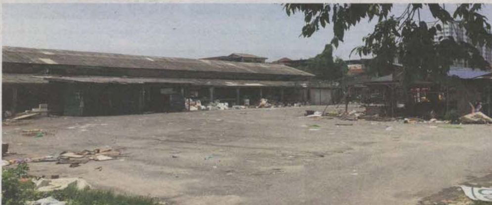
The old market site has been left empty after traders moved out to the new building 200m away.

Not all traders are against the move — some see it as an opportunity to trade in a more comfortable