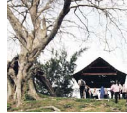
SEBAHAGIAN meriam yang dipacak di atas Bukit Melawati.

Masjid Selangor sehinggalah terbinanya Masjid Sultan Salahuddin Abdul Aziz Shah di Shah Alam. Sekarang ia dimasyhurkan sebagai Masjid Diraja Sultan Suleiman, Klang. Kedudukannya bersebelahan dengan Istana Selangor, Istana Alam Shah dan Kotaj Islam Sultan Alam Shah yang dahulunya termasuk dalam pekarangan Istana.