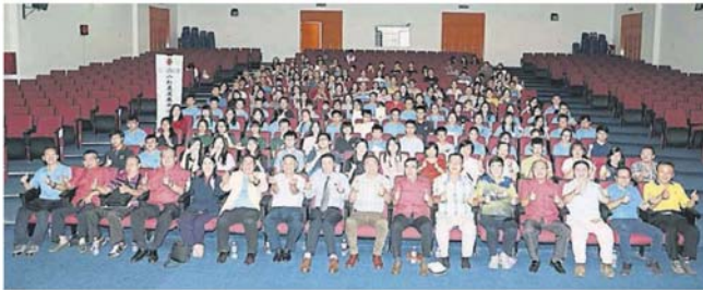
八打灵发展华小工委会举办八打灵国中文进修班结业礼活动，获得多位嘉宾、学生及家长的出席。