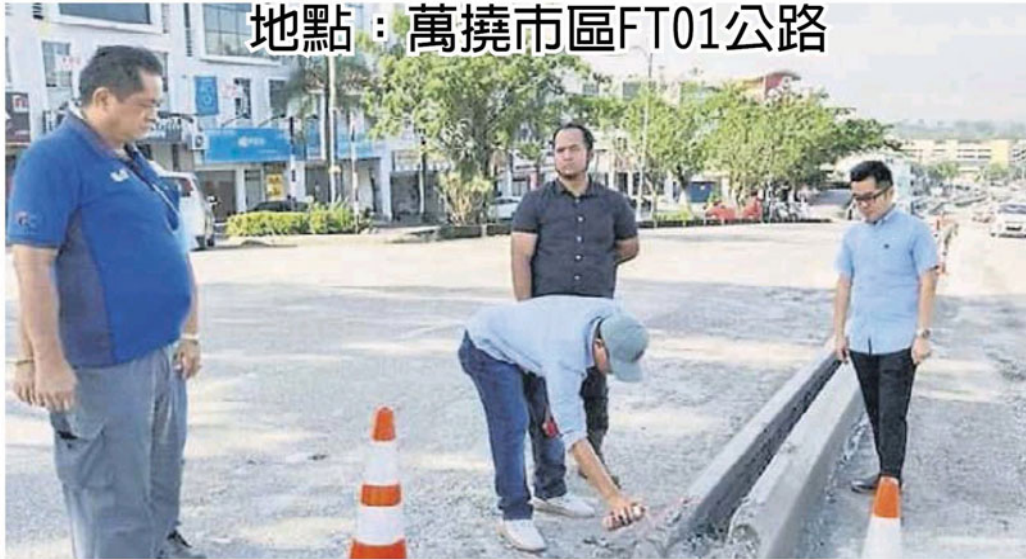
地點：萬撓市區FT01公路