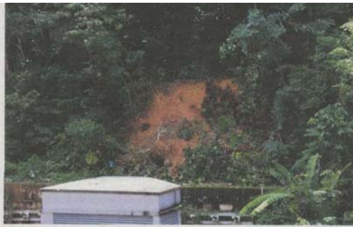
The landslide on a hillslope in Section 16, Petaling Jaya.