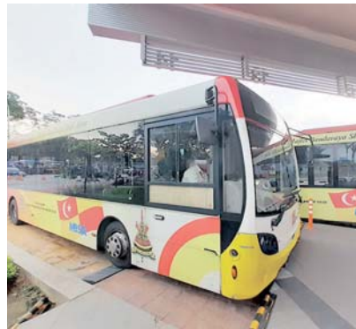
Perkhidmatan Bas Smart Selangor diharap kekal dan diberikan lebih banyak peruntukan dalam Belanjawan Selangor 2020.

rata orang ramai berharap agar perkhidmatan Bas Smart Selangor ini dikekalkan pada masa akan datang.