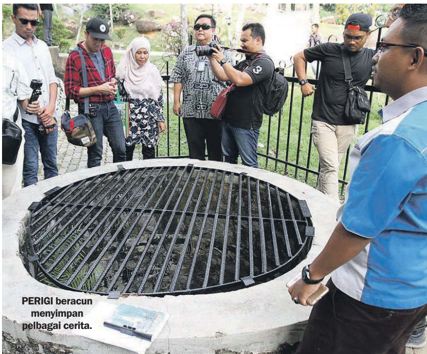
PERIGI beracun menyimpan pelbagai cerita.