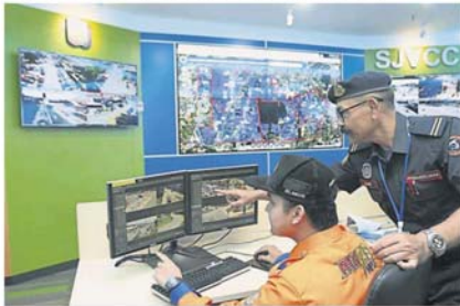
梳邦再也指挥中心时刻关注黑区的情况。