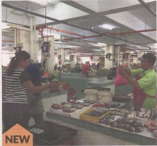
Pasar Warisan Selayang Baru had been operating at an open-air site for close to five decades.