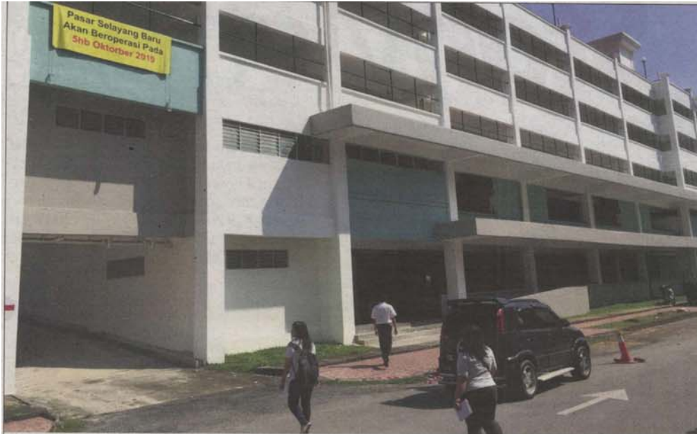
Some traders are adopting a 'wait and see' attitude before deciding whether to do business at the new market.